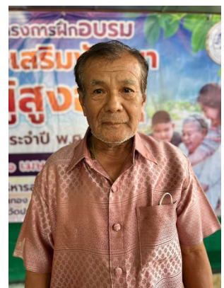
นายยूर ไกล้ซิด ด้านอื่นๆ ประเพณี/การเป็นพิธีกรทางศาสนาในงานต่างๆ